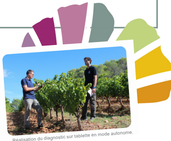
Réalisation du diagnostic sur tablette en mode autonome.